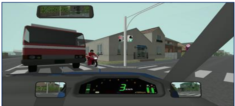
【映像と音声による解説・指導場面】