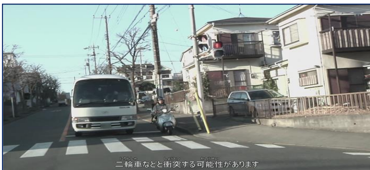
二輪車などと衝突する可能性があります